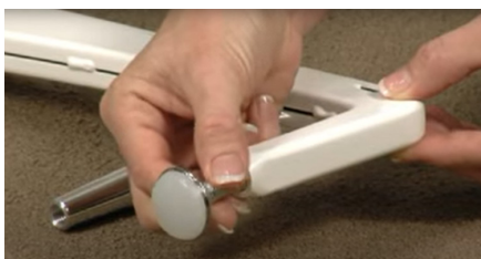
Förlängning av fothöjd